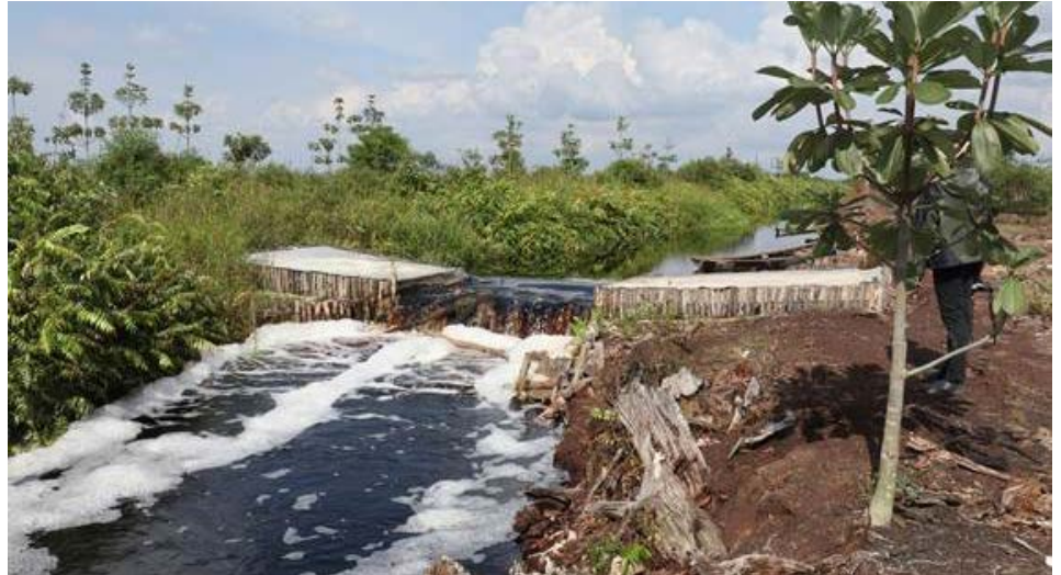
Conjunto de zanjas de drenaje y paludicultura en los alrededores del Humedal de Importancia Internacional Parque Nacional Berbak, Indonesia